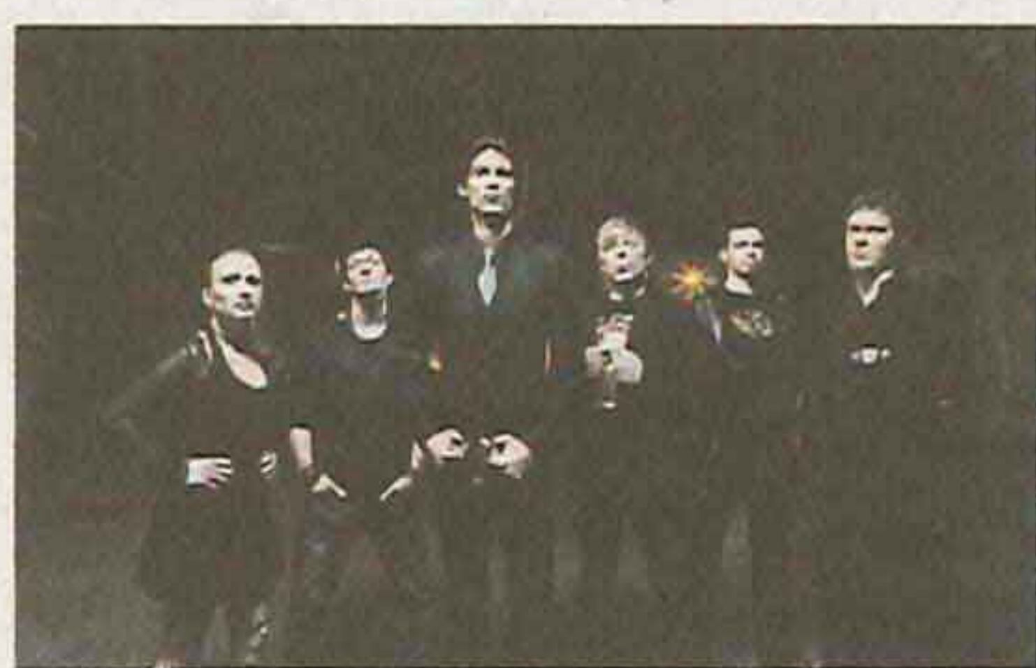
Die Band Schöngest sieht sich als Integrations-Botschafter